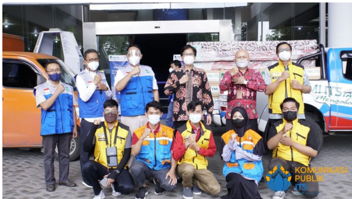
Foto : Para pengurus Yayasan Manarul Ilmi (YMI) ITS, jajaran pimpinan ITS, anggota Satgas Covid ITS, dan para mahasiswa relawan yang tergabung dalam ITS Peduli Bencana usai acara penyerahan bantuan.

mengatakan, bantuan isoman ini dapat dirasakan berkat adanya kerja sama, kepercayaan, dan kepedulian seluruh sivitas akademika, terutama YMI ITS “Semoga kerja sama ITS dengan YMI ITS ini dapat diperluas lagi dan terus dapat memberikan manfaat kepada masyarakat luas,” tuturnya.