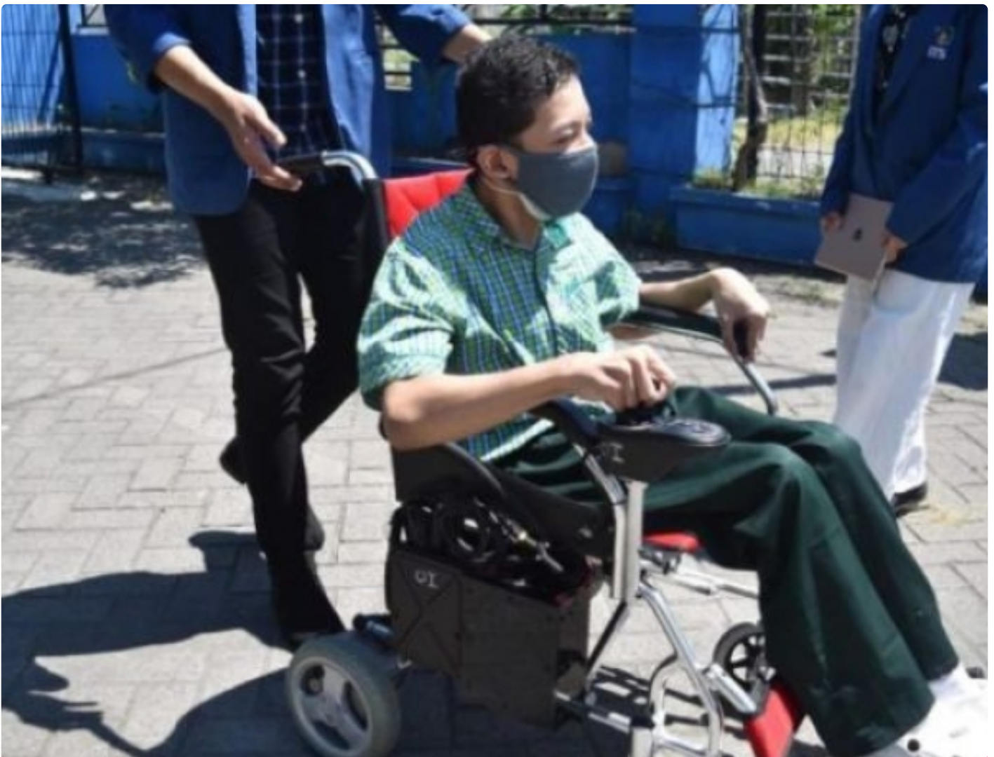
Kursi roda elektrik untuk disabilitas karya mahasiswa Departemen Teknik Biomedik ITS

SURABAYA – Peminatan Teknologi Asistif dan Rehabilitasi Medika merupakan satu dari empat bidang peminatan unggulan di Departemen Teknik Biomedik Institut Teknologi Sepuluh Nopember (ITS). Bidang ilmu ini berfokus pada